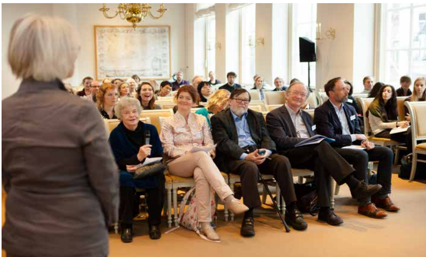
A. S. Byatt aanwezig bij conferentie over Life Writing en European Identities bij Universiteit Utrecht.