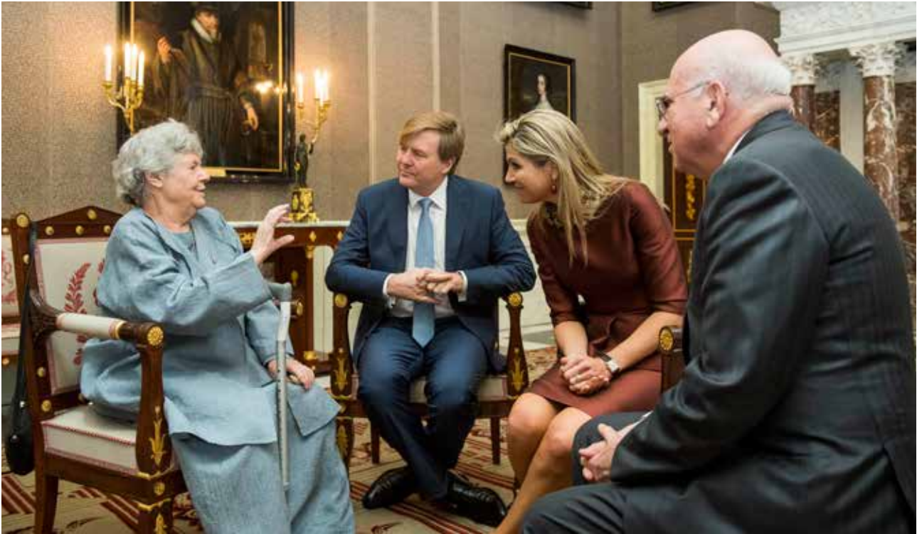
A.S. Byatt spreekt met Zijne Majesteit de Koning en Hare Majesteit de Koningin tijdens de voorontvangst van de Erasmusprijsuitreiking 2016.