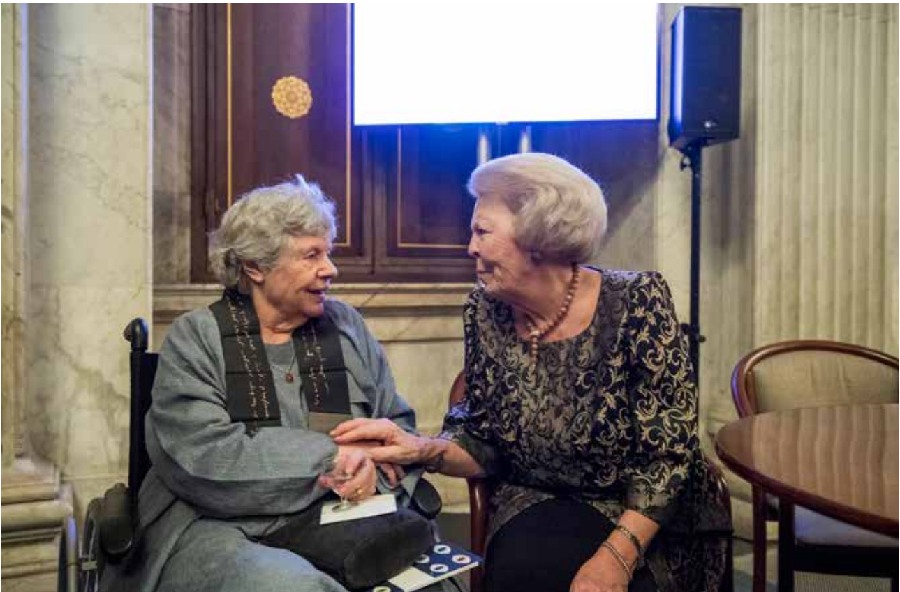
Hare Koninklijke Hoogheid Prinses Beatrix en A.S. Byatt bij de Erasmusprijsuitreiking 2016.