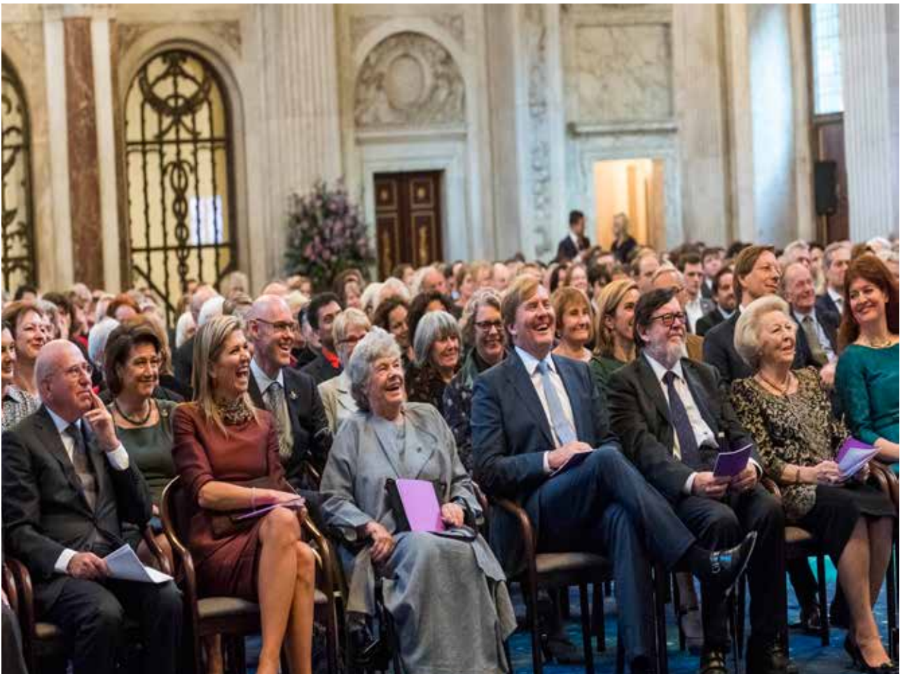
Erasmusprijsuitreiking 2016, Burgerzaal, Koninklijk Paleis Amsterdam.