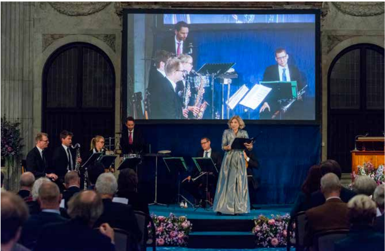
Optreden door sopraan Rosemary Joshua en de musici van De Bezetting Speelt.