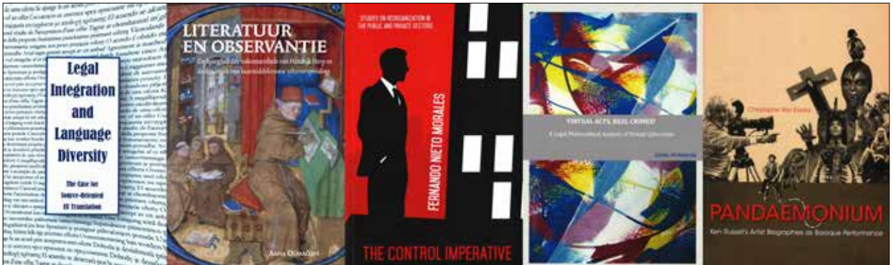
De covers van de winnende proefschriften van 2016